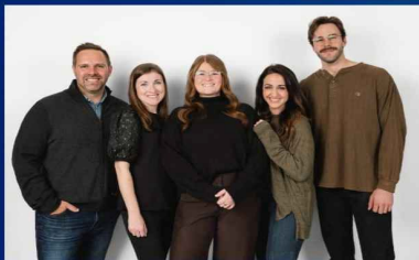
Vigil Project Band