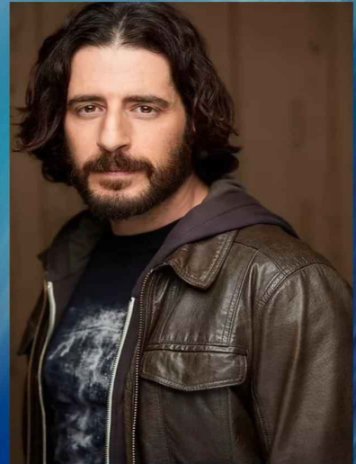
With Jonathan Roumie